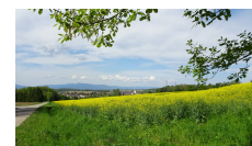
8 – vue sur les Vosges