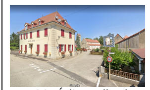
1 Mairie Église Felbach