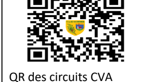
QR des circuits CVA