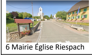
6 Mairie Église Riespach